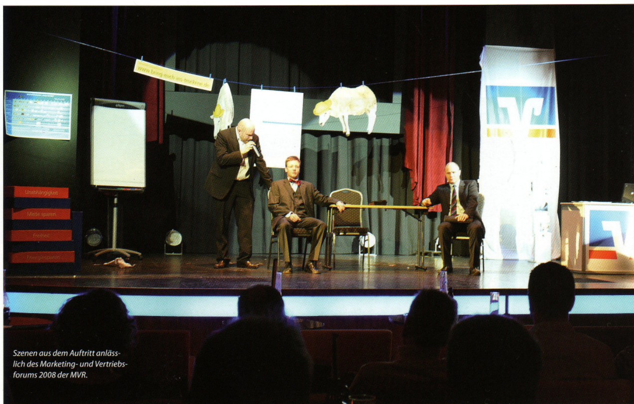
Szenen aus dem Auftritt anlässlich des Marketing- und Vertriebsforums 2008 der MVR.